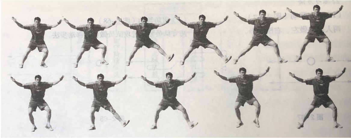
图 1 横滑步技术

被测试者原地防守基本姿势站立，沿九米线先向左侧进行横向滑步动作，连续滑行 3 次后，再向右侧滑步 3 次，此为一个完整动作，共需要进行 3 次完整演示（如图 1 所示）。要求受试者快速滑行，重心低而平稳，目视假想被防守者。