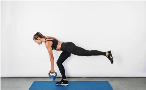
图 4 单腿硬拉