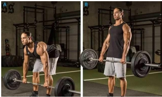
图 5 屈腿硬拉

体直立姿势结束为一次完整动作，动作展示 5 次，整个过程中慢速控制，特别是向下离心动作，动作之间没有间歇，连续完成，如图 5。