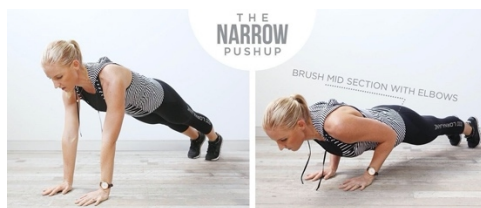
图 2 窄距俯卧撑