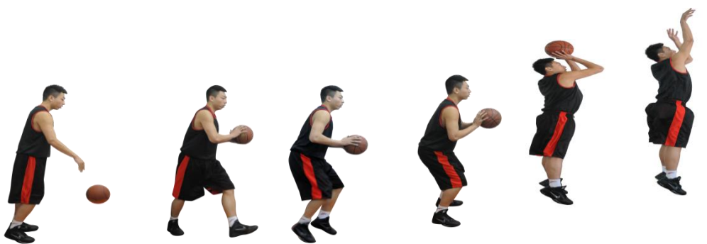
图 1 运球急停跳起单手投篮测试方法