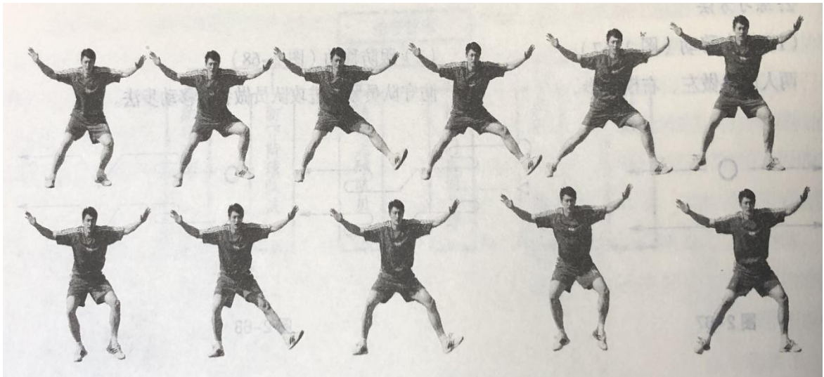
图 1 横滑步技术